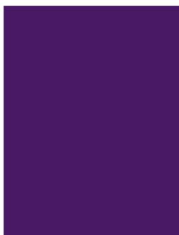
Page entière 290 x 210 mm