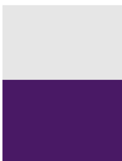
Demi-page 145 x 205 mm