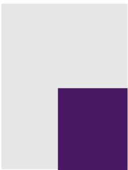
Quart de page 145 x 100 mm